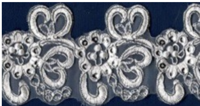
014029---10 LX PLATA 447 6.5