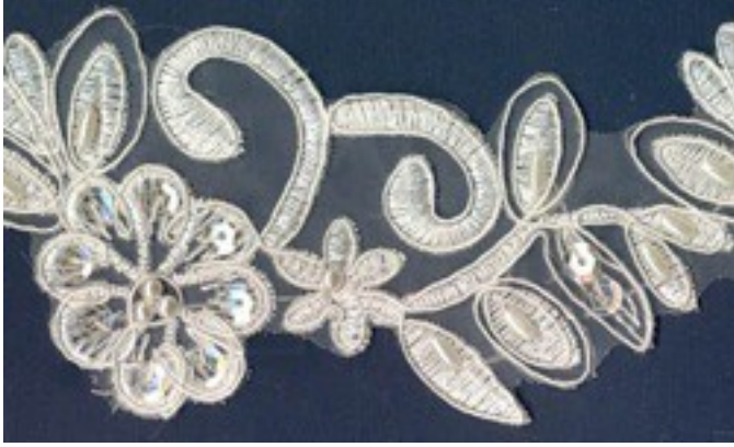
014027---01 BLANCO 496 7.0