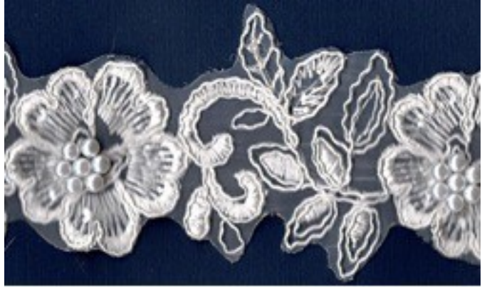
014031---01 BLANCO 503 7.0