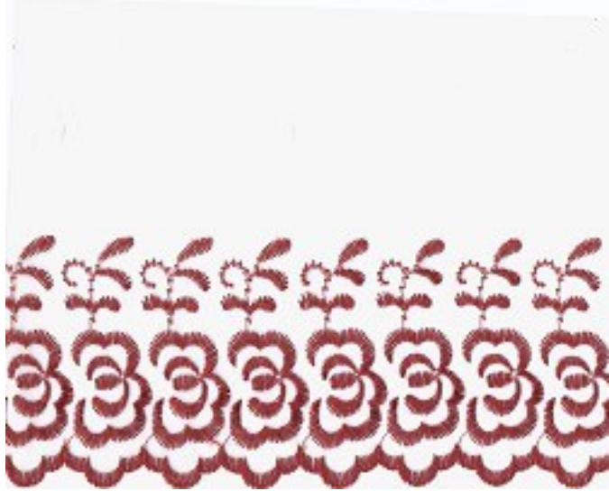
017372---17 VINO 53 13.5