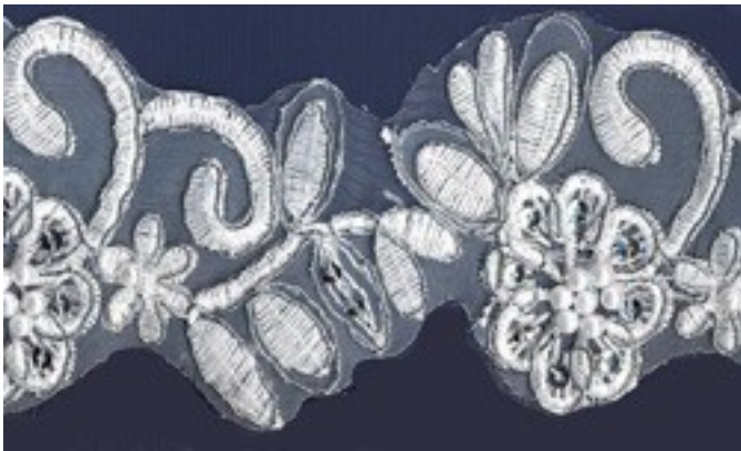
014027---10 LX PLATA 578 7.0