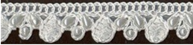
887197---01 BLANCO 505 2.2