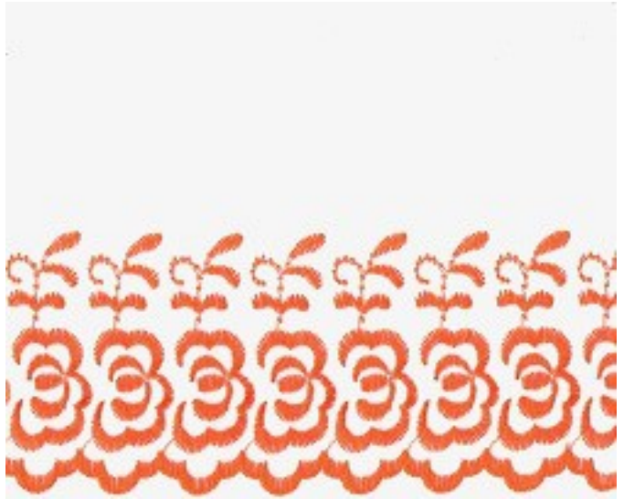
017372---21 NARANJA 95 13.5