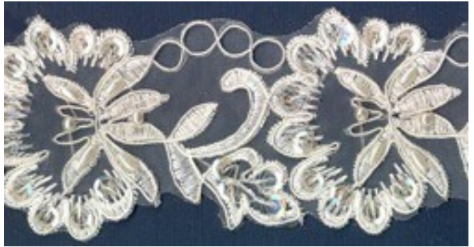
014028---01 BLANCO 482 6.3