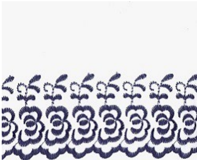
017372---18 MARINO 176 13.5