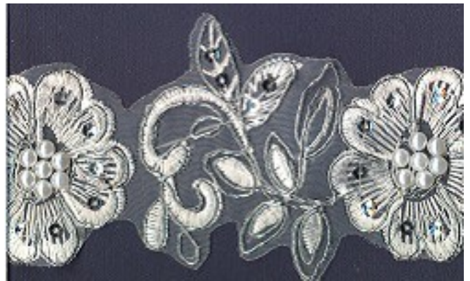
014031---10 LX PLATA 465 7.0