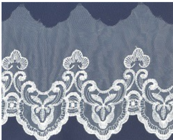
812152---01 BLANCO 71 14.2