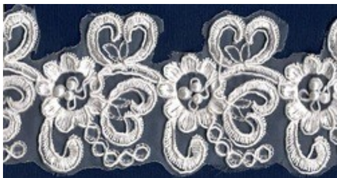
014029---01 BLANCO 431 6.5