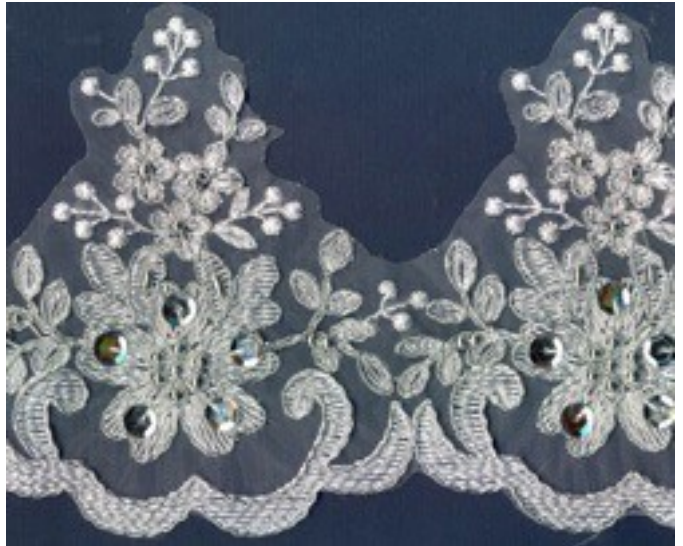
011189---10 LX PLATA 541 13.7