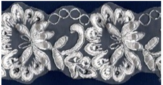
014028---10 LX PLATA 483 6.3