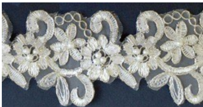
014026---10 LX PLATA 500 6.5