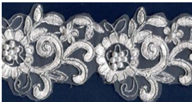
014030---10 LX PLATA 390 6.5