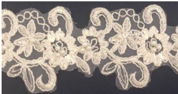
014026---01 BLANCO 396 6.5