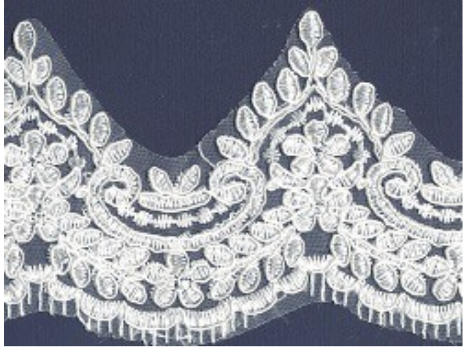
621185---04 IVORY 148 9.0