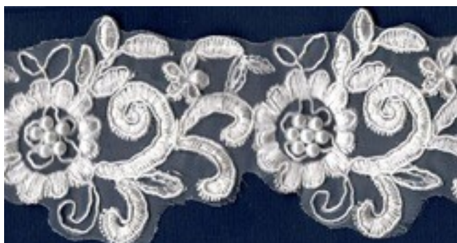
014030---01 BLANCO 404 6.5