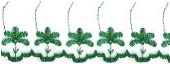
500017---1019 VE BAND 36 4.8