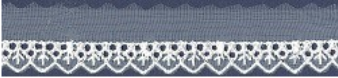
000249OR-04 IVORY 69 2.3