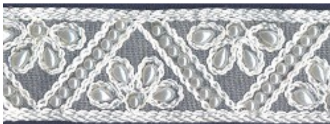
887196---01 BLANCO 198 3.7